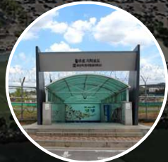
한국항공대학교역 (화전역) 2번 출구