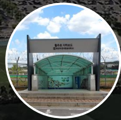
한국항공대학교역 (화전역) 2번 출구